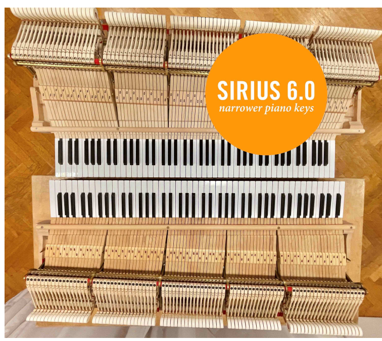
Hammer actions with SIRIUS 6.0 keyboard resp. original 6.5 keyboard for the Steinway D Concert Grand of the HMDK Stuttgart

Reserve your individual playing time on grand pianos with SIRIUS 6.0 piano keys at the HMDK Stuttgart, the HfM Nuremberg, the TLK Innsbruck and the HMT Munich!